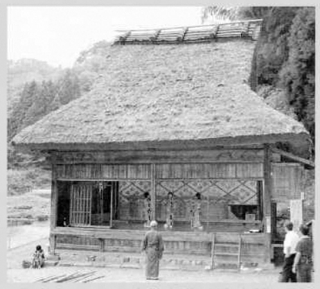
国指定重要有形民俗文化財「葛畑の舞台（芝居堂）」

兵庫・但馬の屋根、氷ノ山の深い谷あいには葛畑（かずらはた）の舞台、芝居堂があり、昭和43年に国の重要有形民俗文化財に指定されています。昭和の初めごろまで盛んであった葛畑の農村歌舞伎は一時衰退します。しかし、地元住民の「もう一度歌舞伎を」という熱い思いが兵庫県、関宮町（現・養父市）や関係者を動かし、平成15年に37年ぶりの復活公演を果たしました。また、次代を担う子どもたちへ農村歌舞伎を伝承するため、同年から子ども歌舞伎公演を行っています。このような活動を通して、伝統ある葛畑農村歌舞伎を伝承してまいります。我々の活動にご賛同いただき、お力添えを賜りますよう、友の会へご入会をご案内申し上げます。