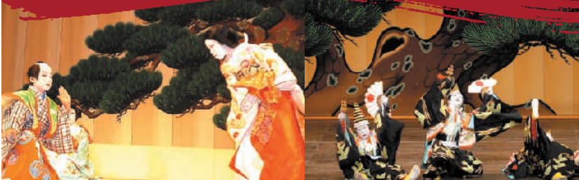
子ども歌舞伎「身替座禅」