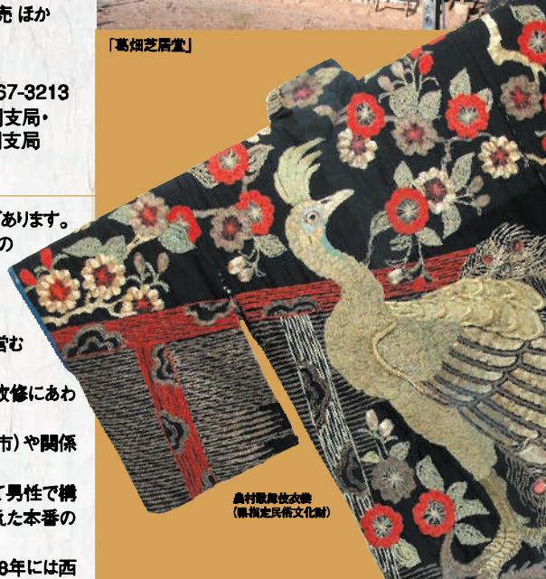
農村歌舞伎衣装 (県指定民俗文化財)